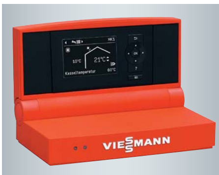
Vitotronic Regelung mit übersichtlicher Menüführung