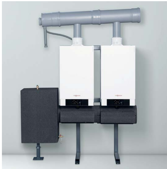
Komplett vormontierte Kaskadenmodule für die Wand oder die freistehende Montage, als Reihen- und Blockaufstellung

Das Vitodens 200-W Gas-Brennwert-Wandgerät ist für den Einsatz in Mehrfamilienhäusern, gewerblichen Bauten und öffentlichen Einrichtungen bestens geeignet.