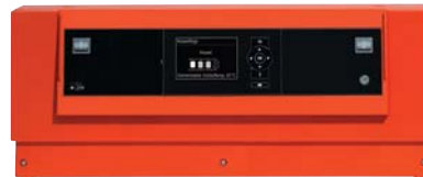
Kaskadenregelung Vitotronic 300-K

Für die Regelung der Kaskade steht die neue Vitotronic 300-K zur Verfügung. Die Klartextanzeige mit grafischer Unterstützung bietet einen hohen Bedienkomfort. Auf Wunsch kann die Heizungsanlage über Vitogate 200 auch in Gebäudeautomations-systeme eingebunden werden.