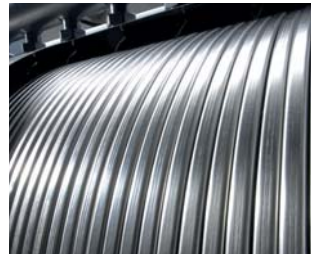
Inox-Radial-Wärmetauscher aus Edelstahl

Edelstahl macht den Unterschied. Der korrosionsbeständige Inox-Radial-Wärmetauscher aus Edelstahl ist das Herzstück des Vitodens 200-W. Er wandelt die eingesetzte Energie besonders effizient in Wärme um. Praktisch verlustfrei, mit einem kaum zu übertreffenden Wirkungsgrad von 98 Prozent. Und das mit der Sicherheit des besonders langlebigen, hochwertigen Edelstahls.