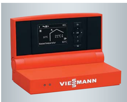
Vitotronic Regelung mit übersichtlicher Menüführung