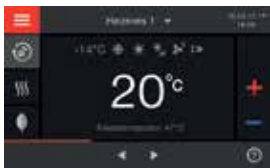
5-Zoll-Farb-Touch-Display der Regelung Vitotronic 200 (Typ HO2B)

* Voraussetzungen und Produktübersicht unter www.viessmann.at/garantie