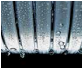
Inox-Radial-Wärmetauscher – langlebig und effizient