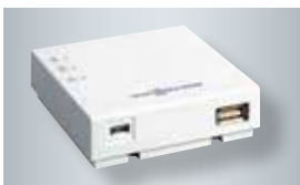
Vitoconnect 100 mit Anschlüssen für das Steckernetzteil (links) und zur Datenverbindung