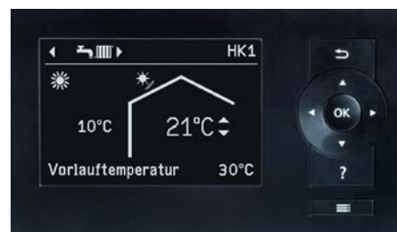
Display der Wärmepumpenregelung Vitotronic 200

Mit fünf Leistungsstufen als Master- oder Master/Slave-Ausführung lässt sich eine Vielzahl von Kombinationen verwirklichen und auf den benötigten Wärmebedarf abstimmen. Diese hohe Variabilität und bedarfsgerechte Auslegung optimiert die Laufzeiten und sorgt für einen wirtschaftlichen Betrieb. Die Regelung des Slave-Moduls übernimmt das Master-Modul. Außerdem lässt sich das gesamte System mit Hocheffizienzpumpen ausrüsten.