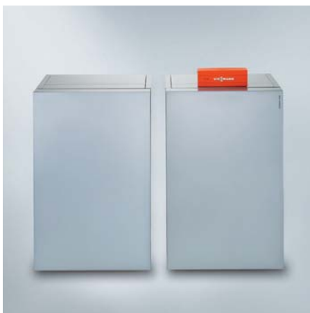
Zweistufige Wärmepumpe Vitocal 300-G (Master/Slave) – für die hydraulische Kopplung der Wärmepumpen-Module untereinander steht ein Verrohrungs-Set mit Armaturen und Absperrhähnen zur Verfügung. Die regelungstechnische Verbindung wird über steckerfertige Leitungen hergestellt.